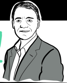
Jordi Sevilla Presidente de IMPULSE, ex-Ministro de Administraciones Públicas.